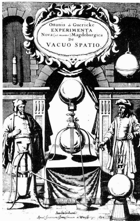
Te zien in EMDEN

CECCARELLI , Maria Grazia Vocis et animarum pinacothecae. Cataloghi di biblioteche private dei secoli XVII-XVIII nei fondi dell'Angelica. Roma: Istituto Poligrafico e Zecca dello Stato, 1990. xxii + 326 pp. 188 gedrukte catalogi van particuliere