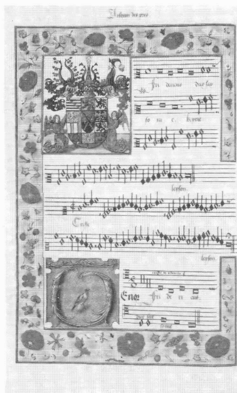
Vierstimmige mis van Joaquin des Prés; afschrift voor Saksische keurvorst, 1519. (Jena, Universitätsbibliothek). Te zien in KASSEL

LEIDEN Museum Boerhaave: De volmaakte mens, anatomische atlas van Albinus en Wandelaar. 3 september tot 5 januari 1992. Tentoonstelling over de ontwerpgeschiedenis van de anatomische atlas van Albinus en Wandelaar (Leiden, 1747/1753). Wandelaars voortekeningen worden in de Leidse Universiteitsbi